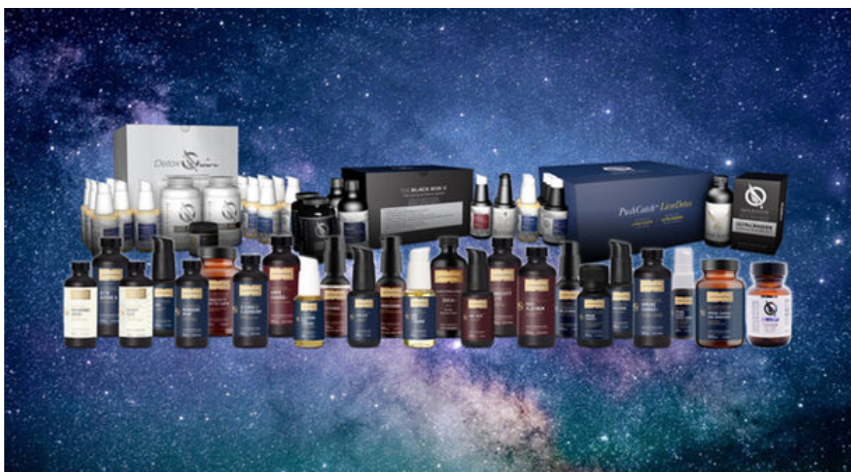
圧倒的な製品力の製品群

特許設計で製造された製品群による唯一無二の圧倒的競争力を、このQSI JPで是非手に入れてください。