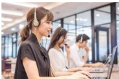
充実のサポート体制