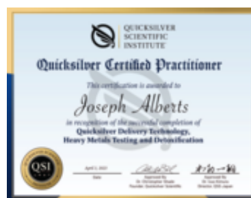
ディプロマサンプル