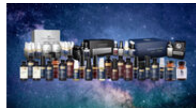
圧倒的な製品力の製品群