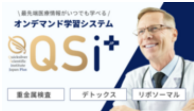
オンデマンド学習システム「QSI JP」