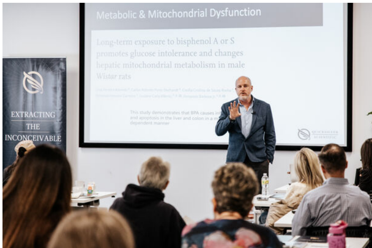
サービスイメージ