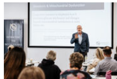
サービスイメージ