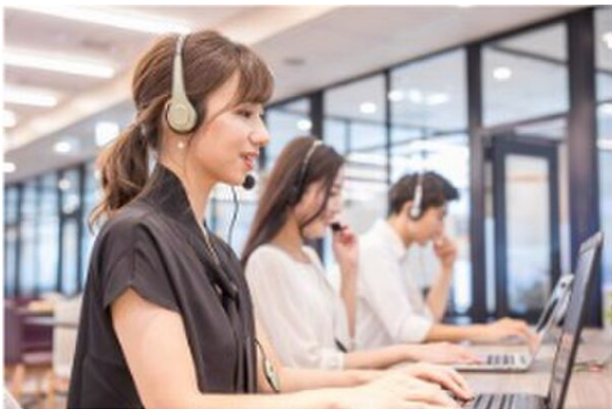
充実のサポート体制

日本ではQSS JAPAN TEAMでしか得られない「勝てる医療」のエッセンスをぜひ取り入れてください。